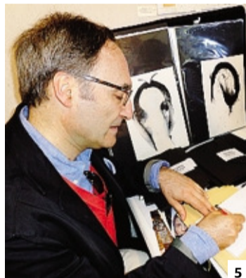
1- Il poeta Yves Bonnefoy 2- Fabio Scotto 3-4 Lo scrittore francese durante una passeggiata e nel suo studio 5- Scotto durante il "Marché de la Poésie"